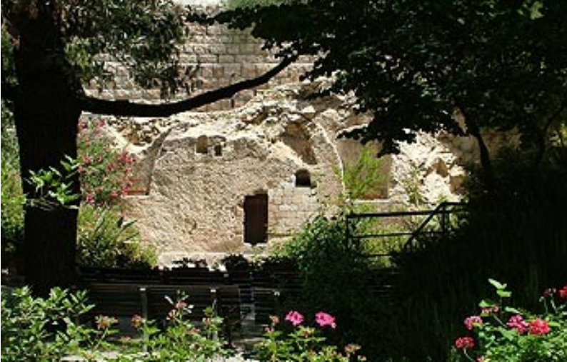
Tumba de Huerto, hallada en Yerushaláyim en años recientes, coincide con la descripción y la ubicación de la tumba en la que, según los Evangelios, Yeshúa fue depositado por sus amigos.

Yeshúa presentó ante YHWH los Primeros Frutos resucitados.