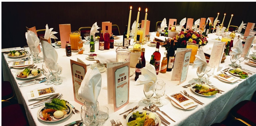
Disposición de una mesa familiar para la celebración de la Pascua*

Para tener la vida, es indispensable apropiarnos del cuerpo y la sangre del Mesías, para que lleguen a ser parte de nosotros. De la misma manera que los alimentos son asimilados por nuestro cuerpo y se transforman para llegar a ser parte integral de nosotros, la Palabra de YHWH, que es Yeshúa hecho carne, necesita ser “asimilada” por nuestro espíritu para que tomando control de nuestra alma, podamos vencer sus vicios y debilidades siendo transformados para ser luz en un mundo decadente envuelto en tinieblas, cumpliendo así el propósito de YHWH para cada uno de nosotros.